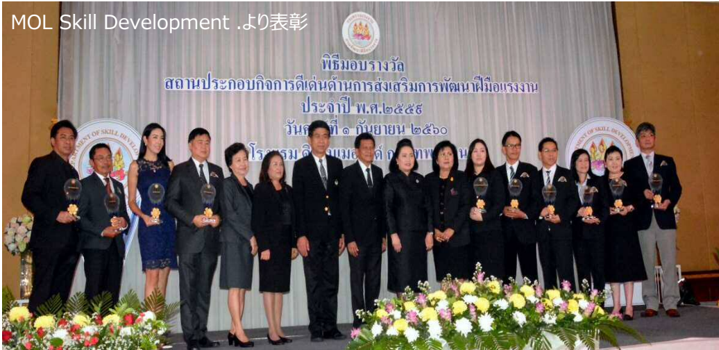
MOL Skill Development より表彰