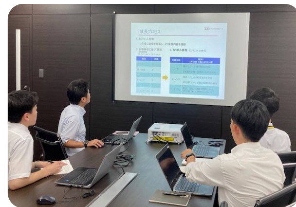
8月29日開催 成果報告会(総括)の様子