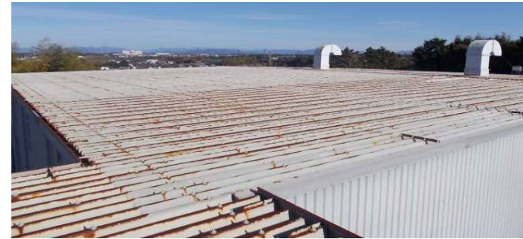
【磐田工場屋根(1,216㎡)】 ボルトキャップ約4,700個使用